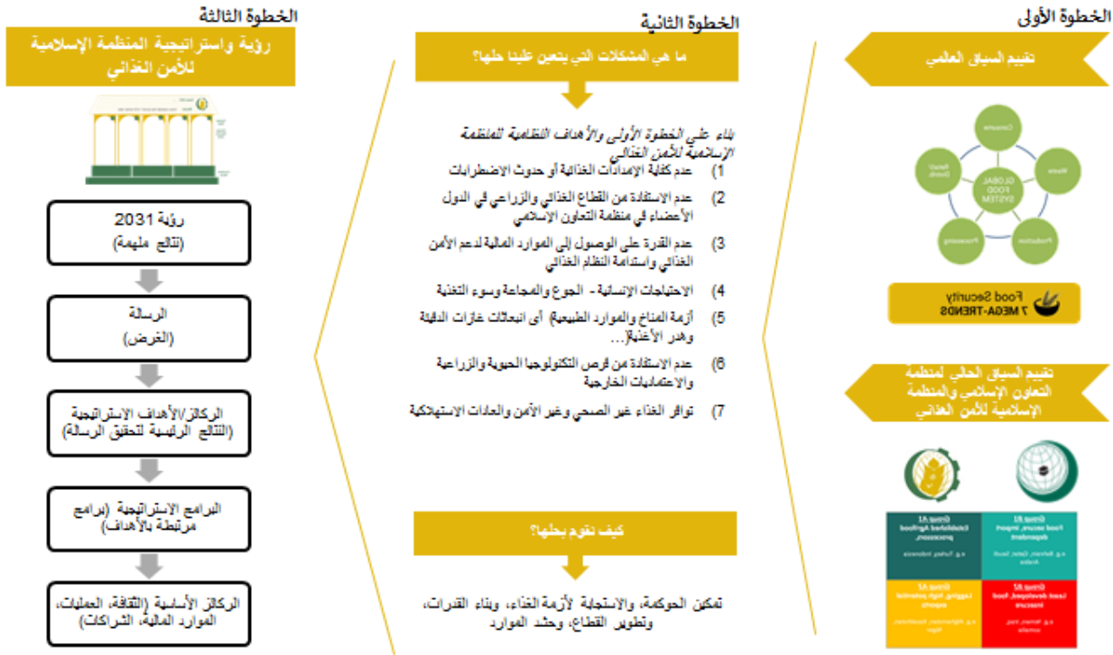
الشكل 5: الإطار الاستراتيجي لرؤية المنظمة الإسلامية للأمن الغذائي 2031

الخطوة الأولى: تحديد السياق طويل الأجل "لأمن الغذائي" الذي ستعمل ضمنه الدول الأعضاء في المنظمة الإسلامية للأمن الغذائي يعرض الفصل 4 الذي تم تناوله سابقاً "الاتجاهات العالمية وسياق منظمة التعاون الإسلامي" منظوراً شاملاً ومدخلات تم من خلالها تحديد المجالات الرئيسية التي يجب معالجتها وتحديد أولوياتها. وقد كانت هذه المعطيات بمثابة مدخلات رئيسية للخطوة التالية.